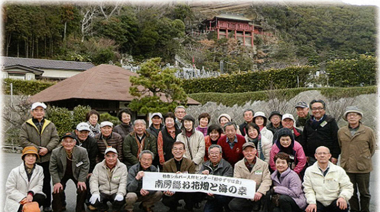
柏ゆずりは会 親睦バス旅行 3月3日

〒277-0005 千葉県柏市柏255番地の33 TEL 04-7166-6681 FAX 04-7163-4150 URL http://www.sjc.ne.jp/kashiwa/ メール kashiwa@sjc.ne.jp