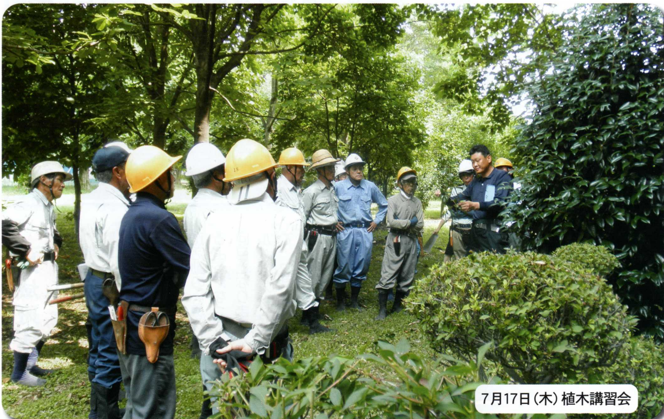
7月17日(木) 植木講習会

〒277-0005 千葉県柏市柏255番地の33 TEL 04-7166-6681 FAX 04-7163-4150 URL http://www.sjc.ne.jp/kashiwa/ メール kashiwa@sjc.ne.jp