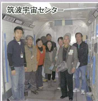
筑波宇宙センター