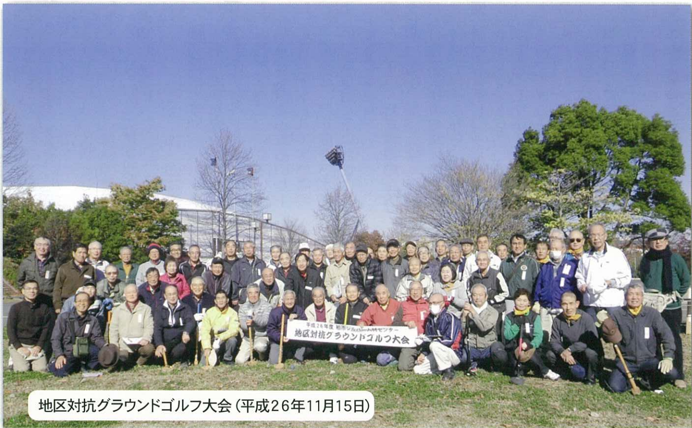
地区対抗グラウンドゴルフ大会 (平成26年11月15日)