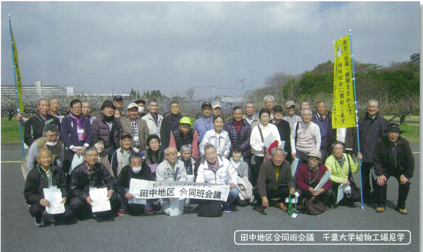
田中地区合同班会議 千葉大学植物工場見学