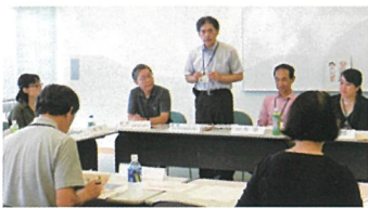
新井・ジョブコーディネーター→