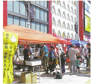
柏まつりには、東口にブースを出店、センターのチラシとうちわを配布しました