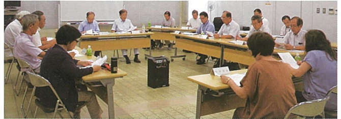
毎月1回の理事会(8月16日(金)の様子)

7月に行われた理事会で、専門部会と安全委員会などの構成メンバーが決定し、活動がスタートしました。新役員と活動内容などについて紹介いたします。