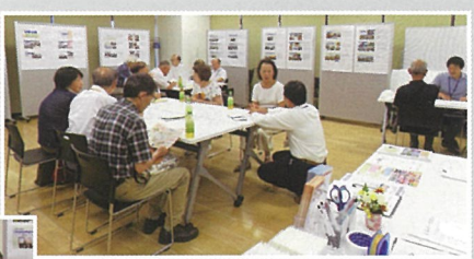
↑ 談話コーナーの様子

8月5日(月)、13時から16時まで、パレット柏多目的スペースAにおいて「シルバーサロン」を開催しました。センターと会員、会員相互の情報交換を行い、また市民にシルバー人材センターをPRするのが目的。会員はじめ市民42名が参加しました。昨年5月、11月に続き3回目となります。 「展示コーナー」では、センター情報の運営の説明や、当誌「ゆずりは」に掲載された写真を展示、これまでの活動状況を紹介したほか、入会を考えている一般市民の方への案内を行いました。