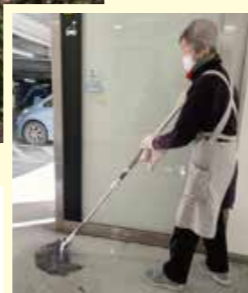
▲エレベーターホール モップ清掃の様子 利用者に細心の注意を払い、丁寧かつスピーディーに。