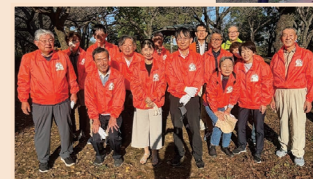
◀秋晴れの下、 清掃活動を 終えて集合 写真。