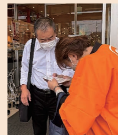
店頭で来店者へ丁寧にご案内。▶ リーフレットをお渡ししてPR を行いました

今後も地域と連携し、シルバー人材センターの活動をより多くの方に知っていただけるよう取り組んでまいります。