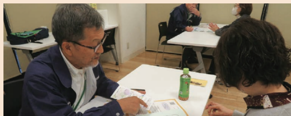
▲ジョブコーディネーターがシルバーについて丁寧に説明中！

めでしたが、参加された方々からは「とても分かりやすかった」「前向きに検討してみます」といった温かいお言葉をいただき、開催できて本当に良かったと思います。